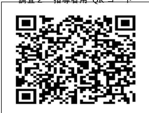
調査2 指導者用 QRコード